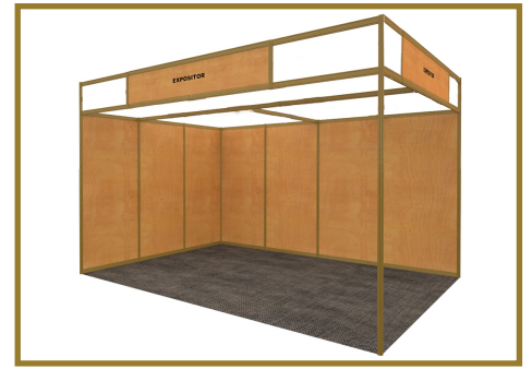
Imagen orientativa. Stand abierto a pasillos. Stand example. Open to aisles.