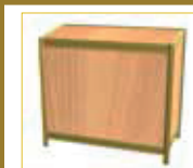
Mostrador Counter (100 x 50 x 90 cm.) 105,00 €