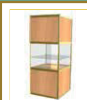
(1x1 m.) Con balda / With self (100 x 100 x 230 cm.) 235,00 €