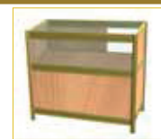
Mostrador vitrina Showcase counter (100 x 50 x 90 cm.) 150,00 €