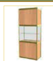
(1x0,5 m.) Con balda / With self (100 x 50 x 230 cm.) 172,00 €